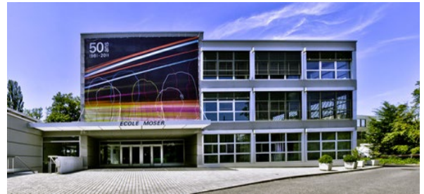
Bâtiment principal de l'école Moser